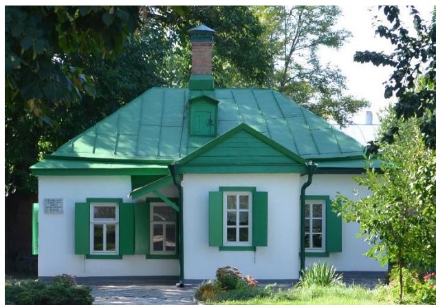
Дом Чеховых в Таганроге

В 1884 году Антон Павлович окончил медицинский факультет Московского университета. Начиная с первого курса он много печатался в развлекательных журналах «Будильник» , «Осколки» , «Зритель» , «Сверчок» , «Стрекоза» в скромных жанрах короткого рассказа, фельетона и подписей к карикатурным картинкам.