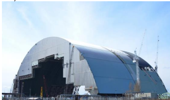
Строительство объекта «Укрытие», 16 апреля 2015

В 2016 году поверх саркофага над четвёртым энергоблоком, защищающего окружающую среду от радиоактивных частиц, построили ещё один – «Укрытие-2». Старый, построенный в 1986 году, рассчитан на 20-40 лет, но из-за высокой степени риска разрушения над ним решили построить новый. 7