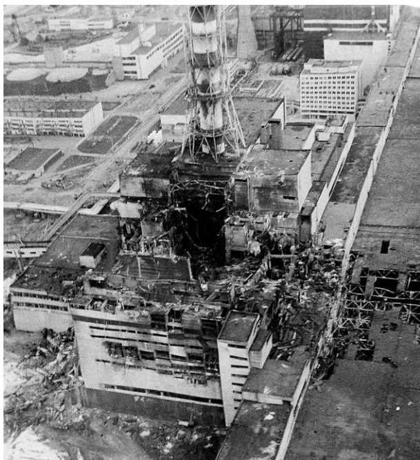
Вид с воздуха на ЧАЭС, после ядерной катастрофы. Снимок сделан через три дня после взрыва на АЭС в 1986 году. Перед дымовой трубой находится разрушенный 4-й реактор.

26 апреля 1986 года в 1:23 ночи произошла авария на четвёртом реакторе Чернобыльской АЭС. В 2023 году исполняется 37 лет с момента Чернобыльской катастрофы – крупнейшей за всю историю ядерной энергетики в мире.