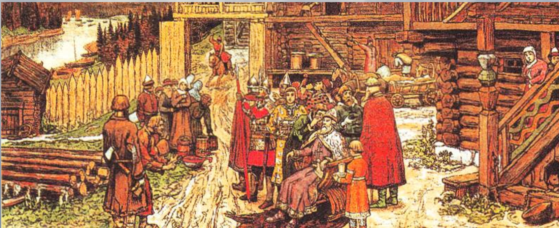
Заключение договора между Русью и Византией

Принятие христианства позволило значительно повысить престиж Руси. После этого получилось укрепить, а также расширить и без того крепкие связи с Византией. Удалось установить контакт с южнославянским миром. Также улучшилась связь с государствами, находящимися на Западе.