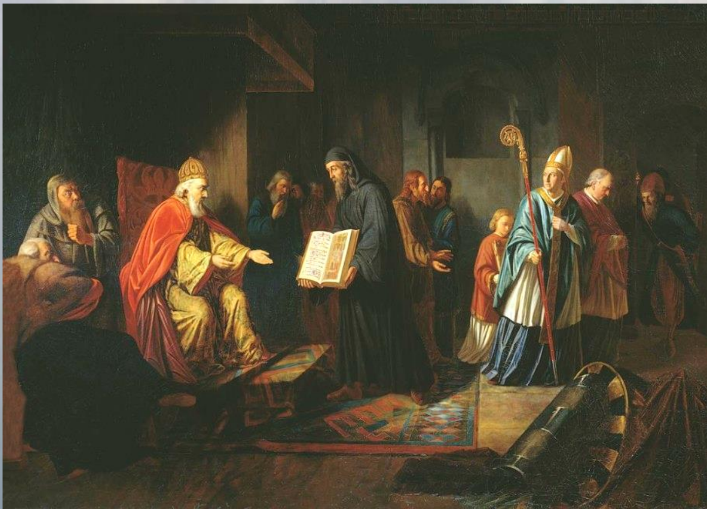
Великий князь Владимир выбирает веру

Проведение крещения сказалось на социальной жизни людей. Церковь стала сильной опорой для правительства. Удавалось за счёт этого соединить в духовном плане все государства. Благодаря принятию христианства удалось быстро укрепить государственные институты.