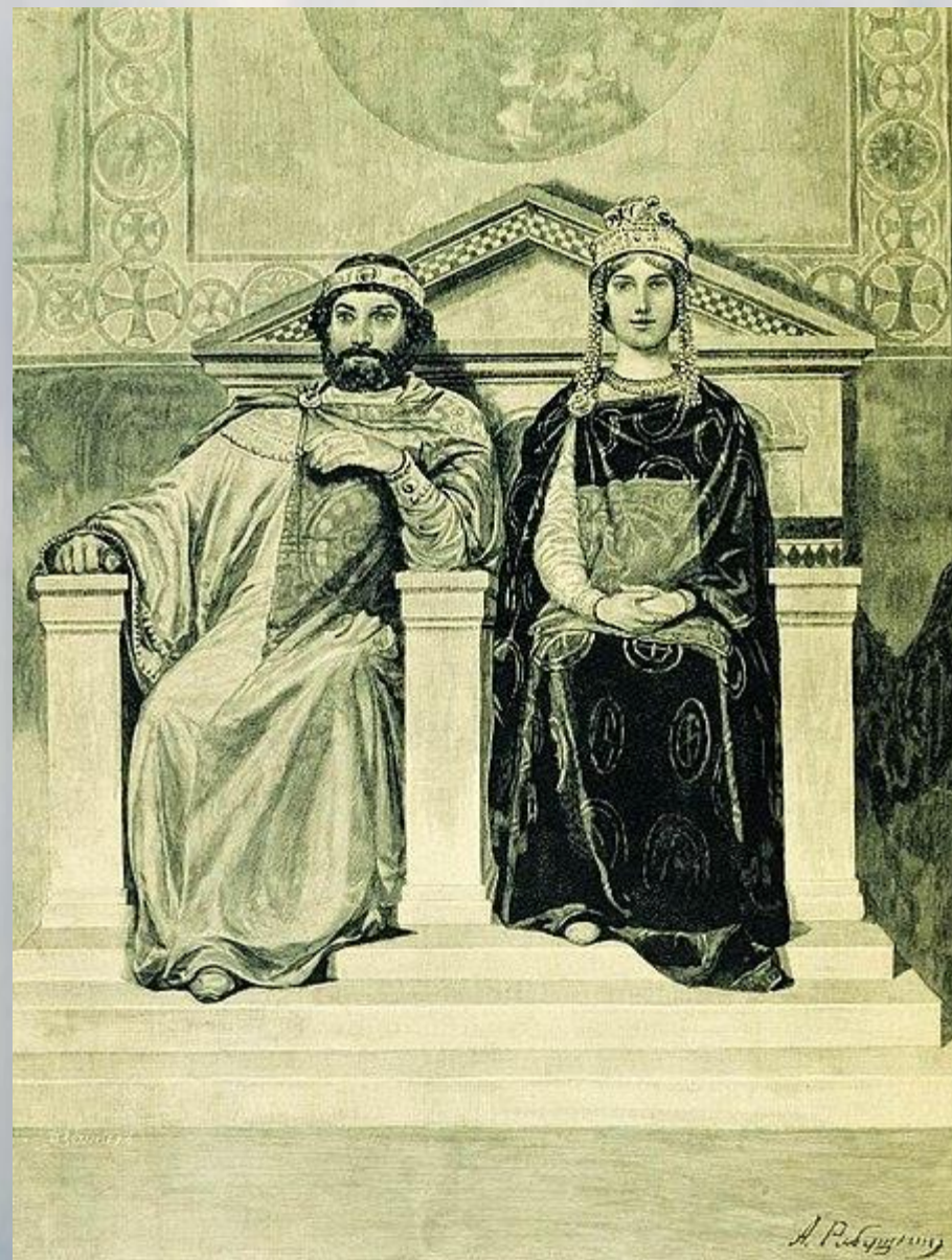
Равноапостольный князь Владимир с супругой княгиней Анной

В конце X века в мире господствовали три крупные религии: христианство, ислам и буддизм. Но Владимир решил последовать примеру своей великой бабушки, княгини Ольги, и выбрал христианство. Согласно другой версии, выбор помогли сделать разосланные в разные страны послы: каждый из них рассказал Владимиру, что может предложить каждая из религий, но именно христианство поразило князя красотой богослужения.