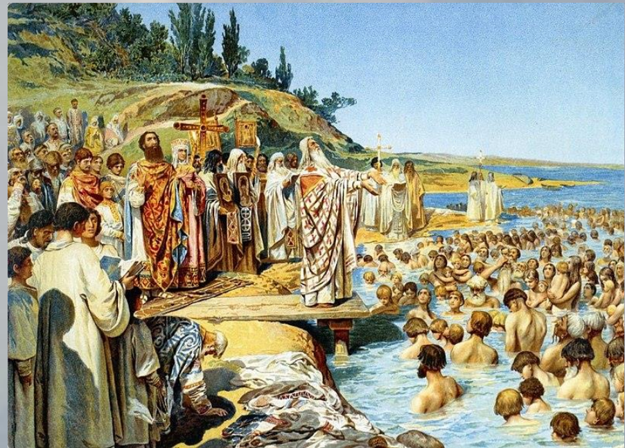
Крещение в р. Днепр