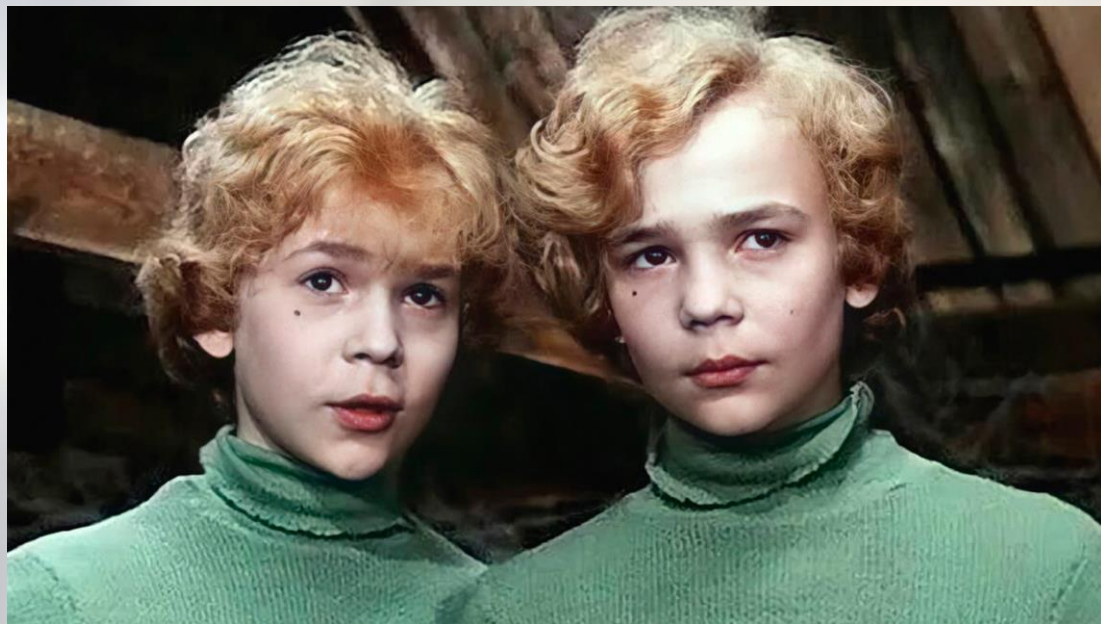
Кадры из к/ф «Приключения Электроника», СССР, 1979

По первым двум произведениям сняли фильм, который для многих стал самым любимым. Книжки об Электронике были так популярны, что в библиотеках мальчишки и девчонки записывались за ними в очередь. Именем Электроника называли кружки, и все мечтали о таком друге.