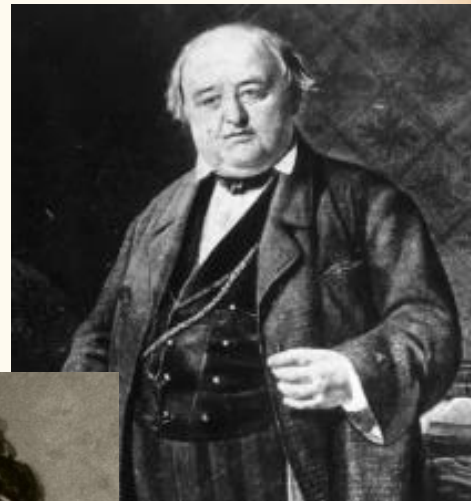
М. С. Щепкин