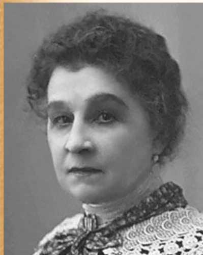
М. Н. Ермолова