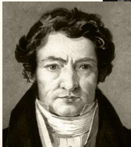
П. С. Мочалов