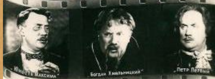
Михаил Жаров (1899–1981)