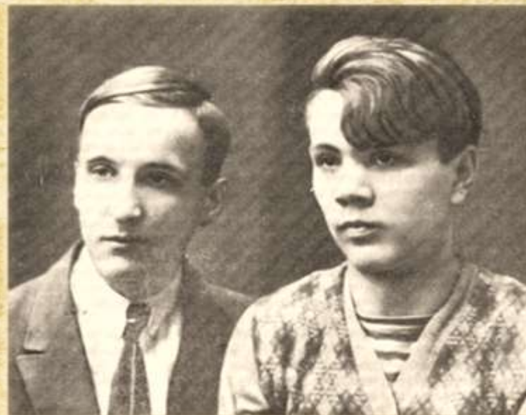
Георгий Белых и Леонид Пантелеев