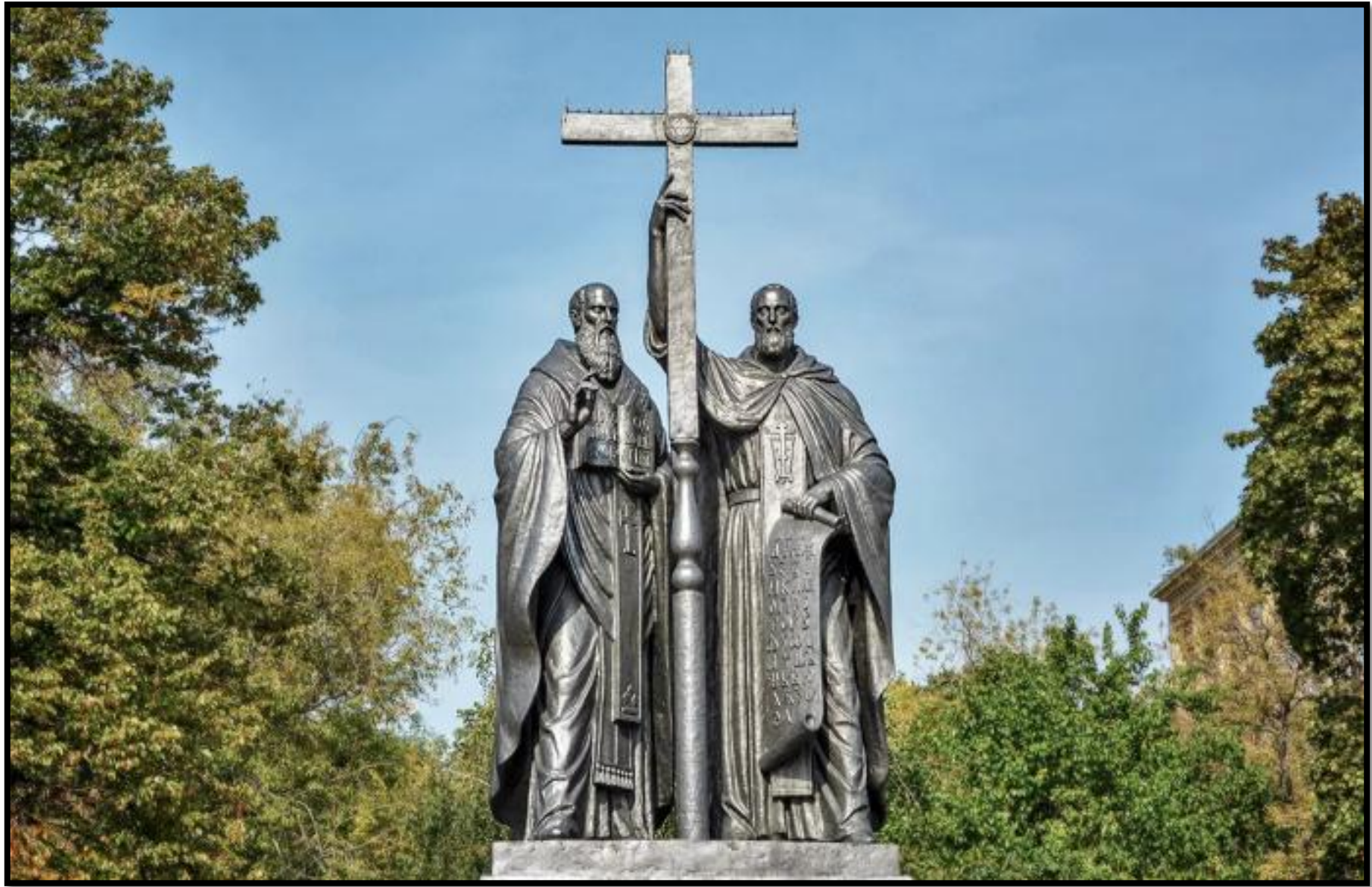
В 1992 году скульптор В. Клыков создал памятник славянским просветителям Кириллу и Мефодию, который установлен в Москве.