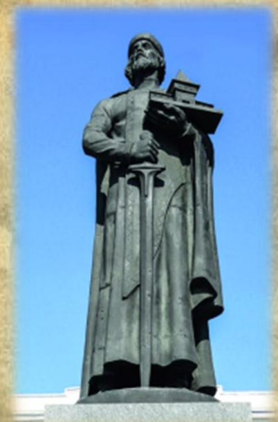
Памятник Ярославу Мудрому В Ярославле