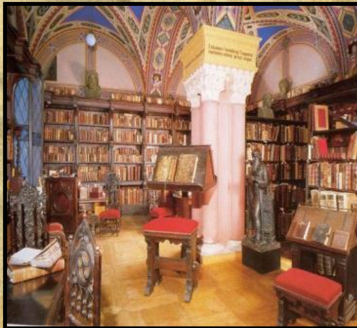
Библиотека Ярослава Мудрого в Софийском соборе