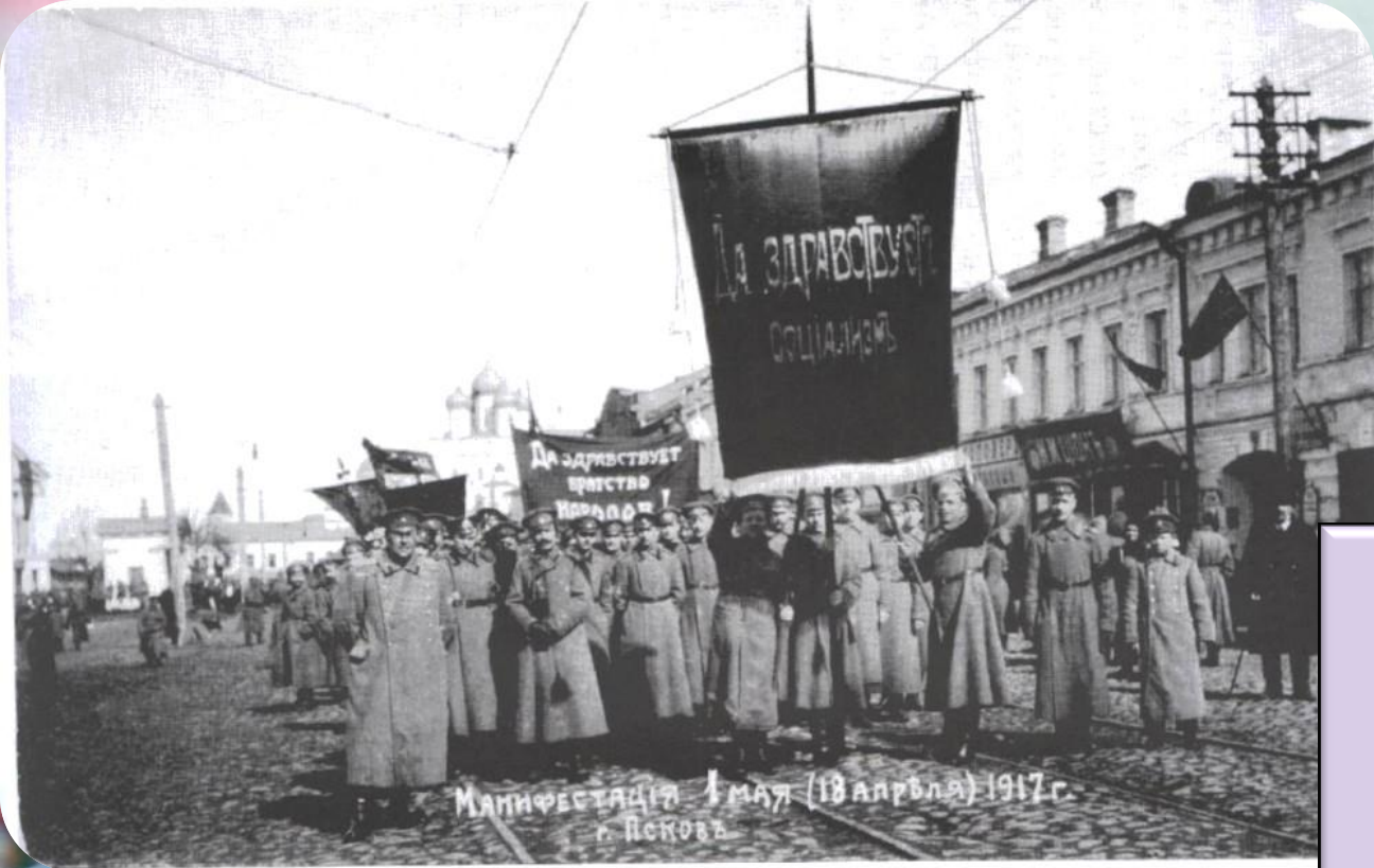
Манифестация 1 мая (18 апреля) 1917 г. г. Никова

В России Первомай впервые открыто отпраздновали в 1917 году после Февральской революции.