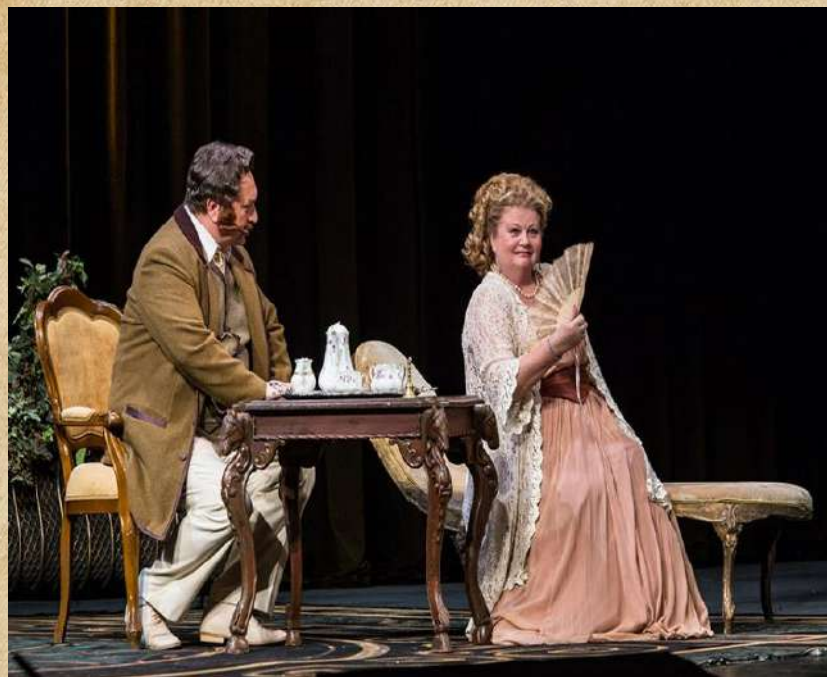
«На всякого мудреца, довольно простоты»

С 1853 года каждый сезон в Московском и Петербургском театрах сопровождается спектаклями по Островскому.