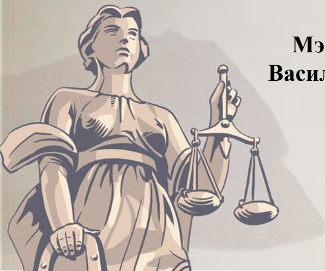
Мэр Анапы Василий ШВЕЦ

Он представляет муниципалитет в отношениях с органами местного самоуправления других образований и органами государственной власти, гражданами и организациями, подписывает нормативные правовые акты и так далее.