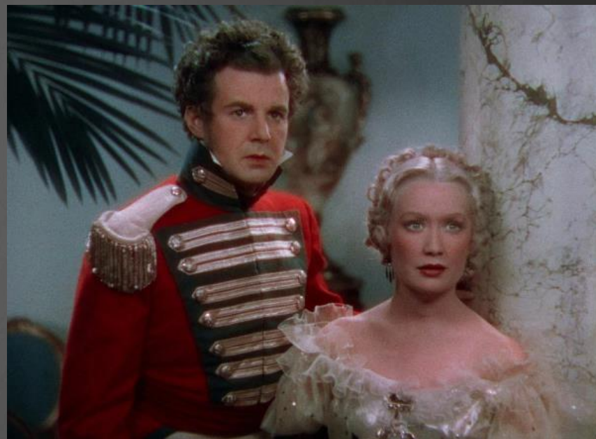
Кадр из фильма «Бекки Шарп»