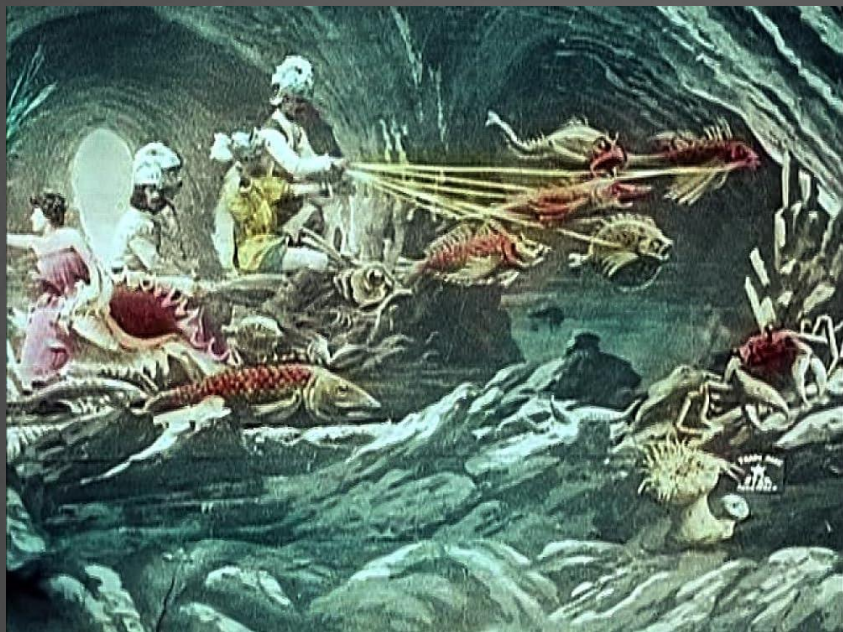
Кадр из фильма «Царство фей», 1903

В 1903 году вышел фильм с первыми спецэффектами. В 1927 году кассовый сбор первого звукового фильма собрал рекордную сумму 400 тыс. долларов. В 1936 году появились первые черно-белые 3D фильмы германского производства.