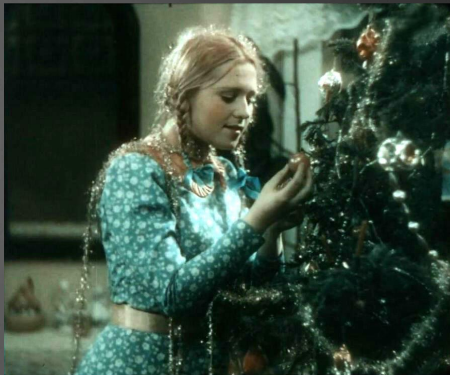
Кадр из фильма «Груня Корнакова»