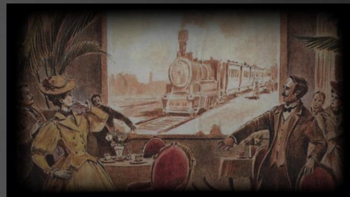
Кадр из фильма «Прибытие поезда на вокзал ла Сьота»