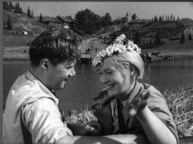
Кадр из фильма «Волга-Волга» (1938) (СССР)