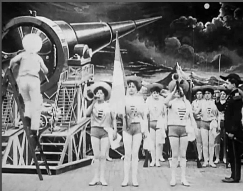
Кадр из фильма «Путешествие на Луну»

В 1902 году появился первый постановочный фильм Ж. Мельеса «Путешествие на Луну», в этом же году вышла первая цветная лента Э. Тернера. Годом рождения первого цветного полнометражного кино стал 1935 г., когда на экраны вышел фильм «Бекки Шарп» американского режиссёра армянского происхождения Р.Мамуляна.