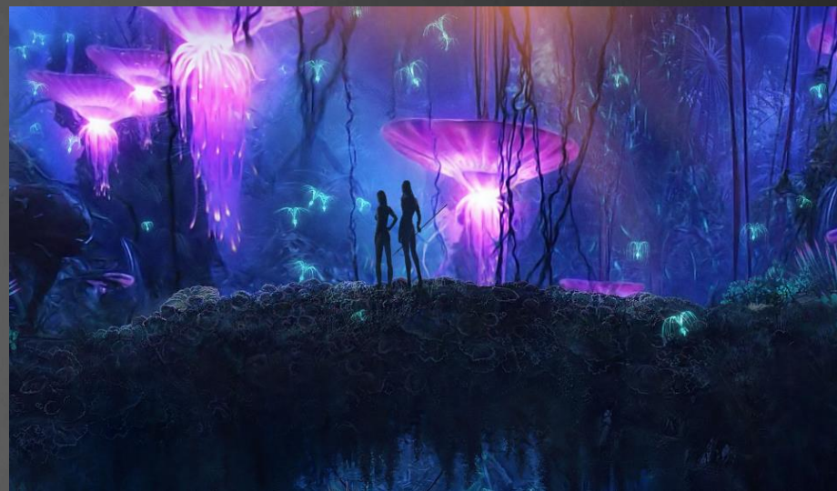
Кадры из фильма «Аватар»