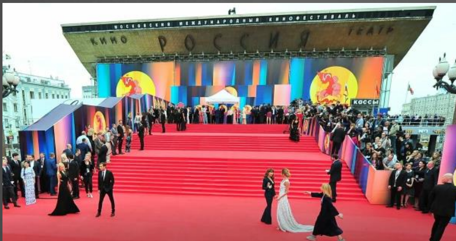
Московский Международный кинофестиваль

Первые фильмы были немymi и чёрно-белыми. Затем в кино пришёл звук, цвет, а сейчас оно уже стало цифровым. И, как известно, фильмы бывают разных жанров: научные, документальные, публицистические, художественные. А по всему миру сегодня проводится много различных кинофестивалей: Московский Международный кинофестиваль, Каннский кинофестиваль, Венецианский международный кинофестиваль, «Берлинале», фестиваль имени братьев Люмьер, «Оскар» и другие.