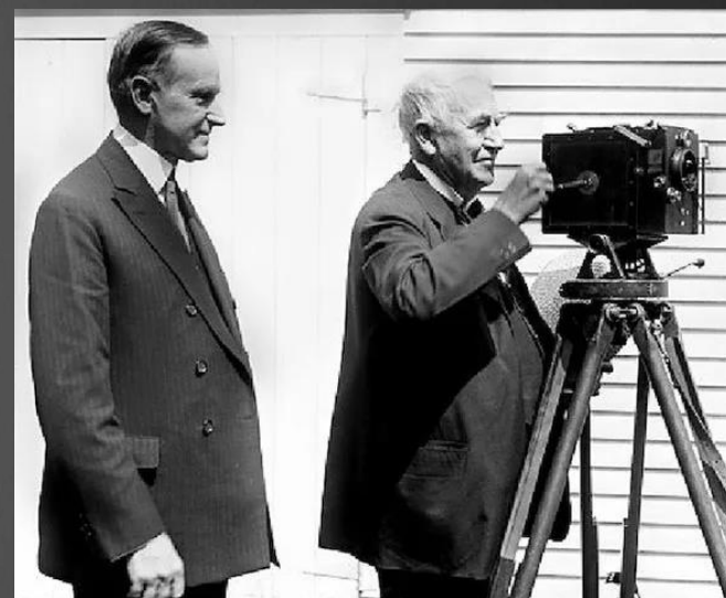
Томас Эдисон и Уильям Диксон