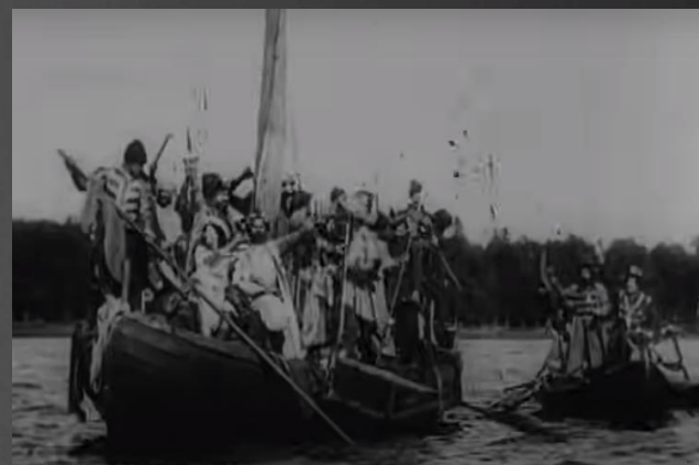
Кадры из фильма «Понизовая вольница»