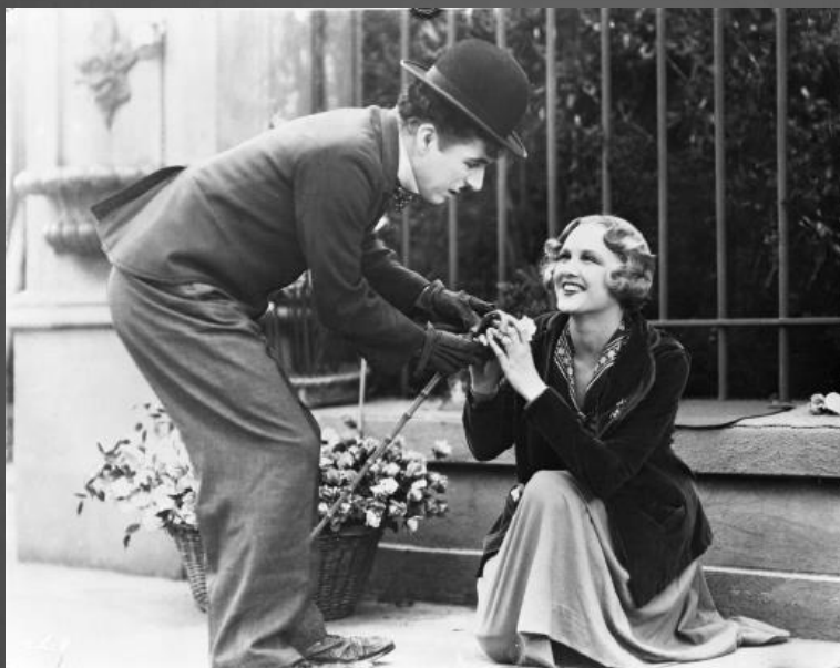
Кадр из фильма «Огни большого города» (1931) (США)

Кинематограф – это искусство, которое постоянно развивается и оказывает огромное воздействие на мировую культуру. История кино полна ярких моментов и великих фильмов, которые навсегда останутся частью нашей культурной памяти.