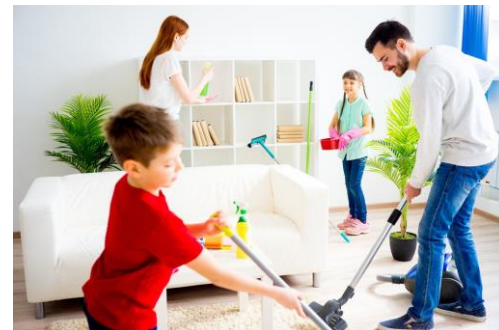
Традиции трудового воспитания