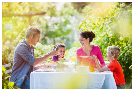
Традиции семейного досуга