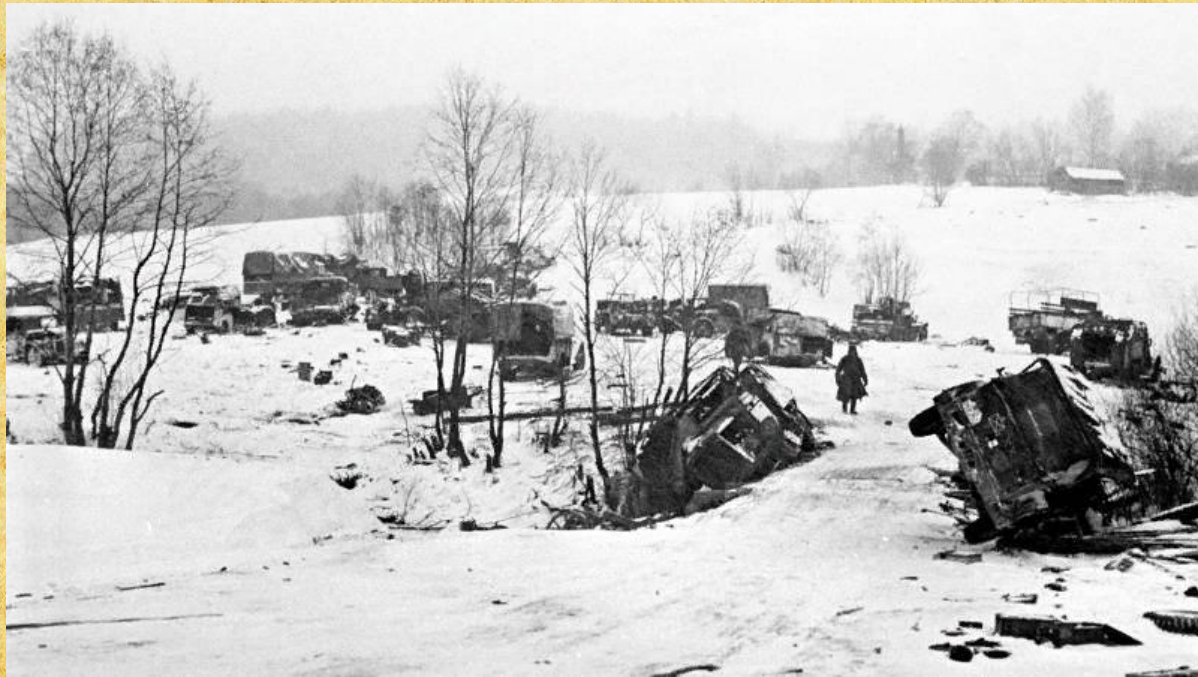
Разбитая немецкая автотехника, брошенная под Москвой

В начале декабря 1941 года немецкое командование уже чётко понимало, что блицкриг в России не удался. Фашистский генерал Гейнц Гудериан написал об этом так: «Наступление на Москву провалилось. Все жертвы и усилия наших доблестных войск оказались напрасными... силы и моральный дух немецкой армии были надломлены». Гитлер был взбешен катастрофой под Москвой. Представление о непобедимой немецкой армии было развеяно.