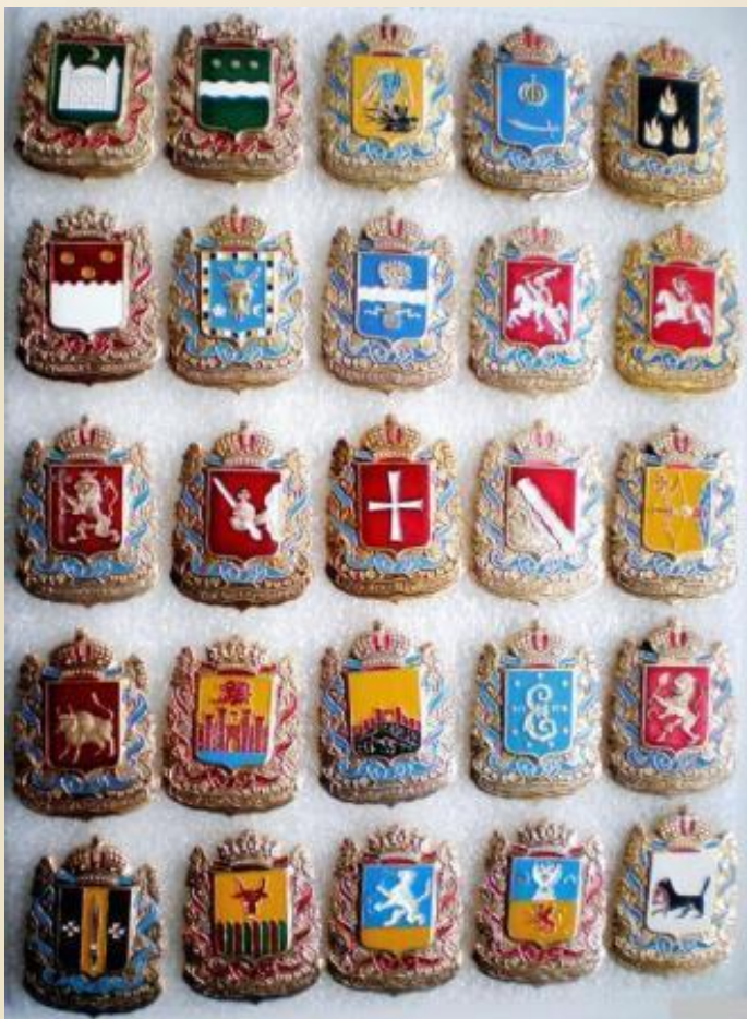
Гербы губерний Российской империи

Образование Российской Империи произошло в 1721 году, когда последний российский царь Петр 1 Великий объявил себя императором российским. В период существования Российской Империи вложилось множество судьбоносных моментов – войны, бунты, динамичное экономическое и культурное развитие, территориальное расширение и т.д. Российская Империя была самодержавной по форме своего правления, где вся полнота власти сосредотачивалась в руках 1 человека – императора. История Российской Империи оборвалась 1 сентября 1917 года, когда была провозглашена Республика.