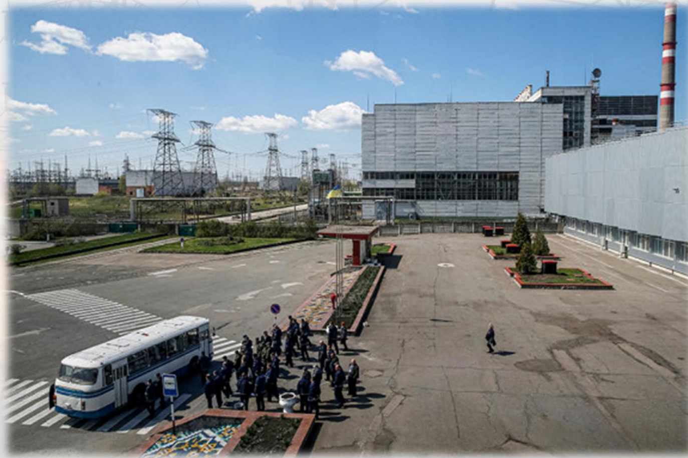
Сотрудники ЧАЭС после рабочего дня ждут автобус

Живут в Чернобыле преимущественно лесники, экологи, ученые, персонал, обслуживающий ЧАЭС, и личный состав МВД Украины, охраняющий 30-километровую зону от проникновения нелегалов.