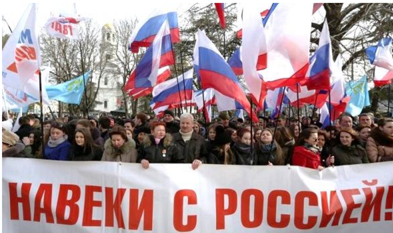
Крым. Март 2014

Владимир Путин: «В Крыму буквально всё пронизано нашей общей историей и гордостью. <...> Крым в сердце и сознании людей был и остается неотъемлемой частью России».