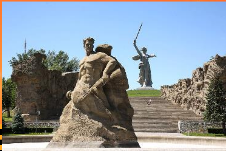
Памятник-ансамбль Мамаев курган

В Волгограде на Мамаевом кургане воздвигнут мемориальный комплекс. Этот исторический памятник называют Российским чудом света. Протяжённость его 1,5 км. Все сооружения сделаны из железобетона. В центре комплекса стоит монумент «Родина-мать зовёт!». Придумал этот ансамбль-памятник скульптор Евгений Вучетич. Это одна из самых прославленных статуй в мире. Её высота 85 метров. От подножия кургана к его вершине ведут 200 ступеней – по числу дней битвы. Ступени начинаются около Зала Воинской славы, в центре которого расположена 5-метровая скульптура-рука. Она держит факел с огнём Вечной славы павшим героям.