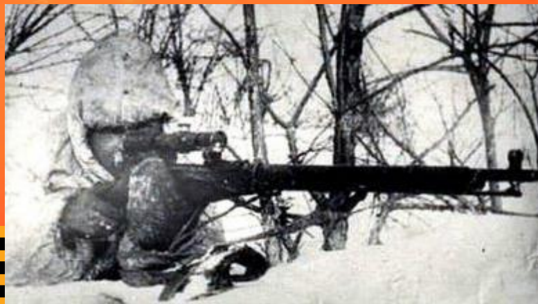
Василий Зайцев в засаде на Мамаевом кургане

Самый известный снайпер на Сталинградском фронте – Василий Зайцев. Этому воину принадлежат слова: «За Волгой земли нет. Мы стояли, и будем стоять насмерть». Особенно прославил его поединок с начальником Берлинской школы снайперов – майором Кёнингсом, который он выиграл. За меткий огонь снайперу присвоили звание Герой Советского Союза. На счету у него 300 убитых фашистов.