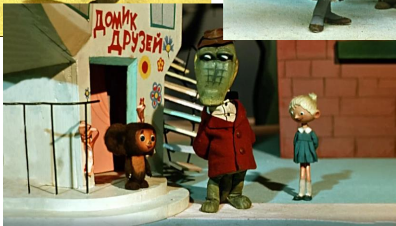
Кадры из мультфильма «Чебурашка и крокодил Гена», СССР (1969–1983)