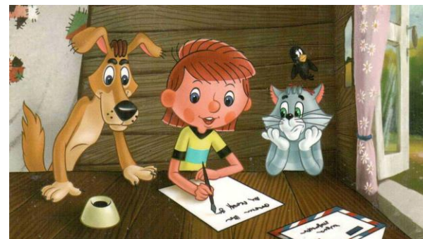
Кадры из мультфильма «Дядя Фёдор, пёс и кот», СССР (1975–1976)