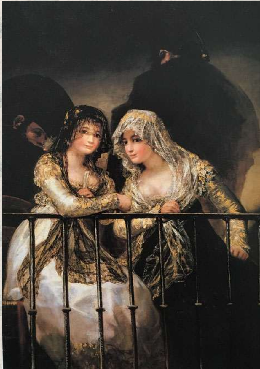
«Махи на балконе»