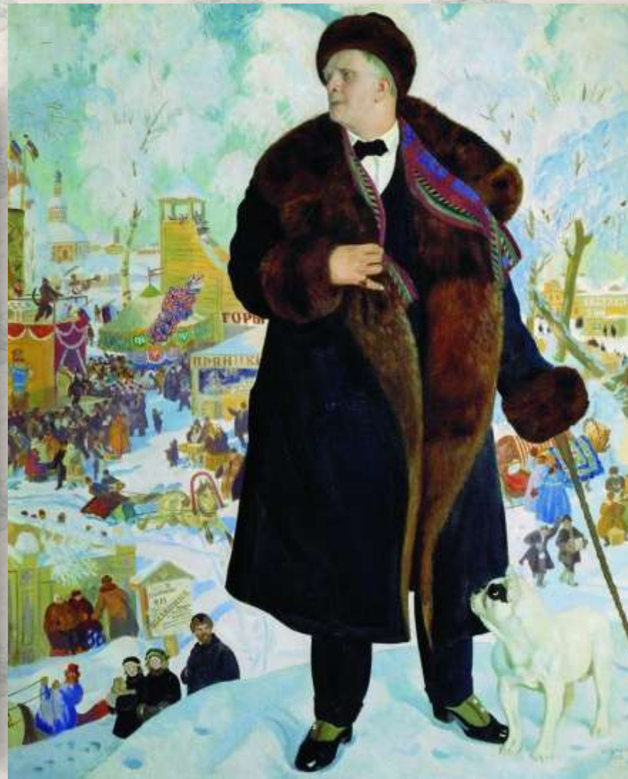
«Портрет Ф. И. Шаляпина»