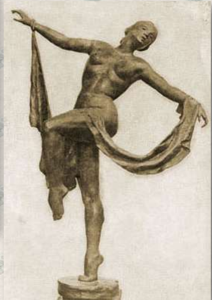
«Танец с покрывалом»