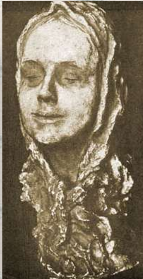
«Девушка в платочке»