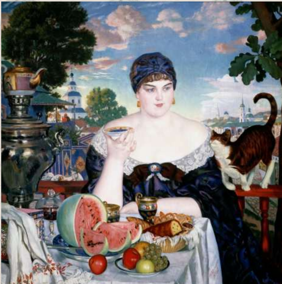
«Купчиха за чаем»