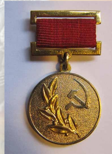
Медаль лауреата Государственной премии СССР

Повесть «В окопах Сталинграда» впервые опубликована как роман под заглавием «Сталинград» в 1946 г. За эту книгу, после её прочтения Иосифом Сталиным, В. Некрасов получил в 1947 году Сталинскую премию 2-й степени.