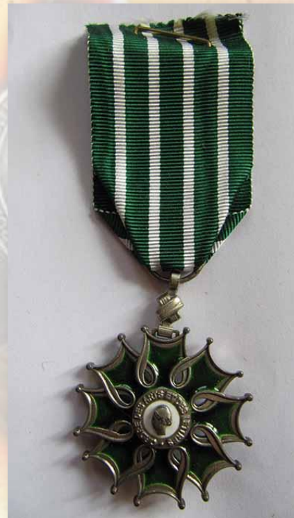
Французский орден Искусств и Литературы (21.02.1986)