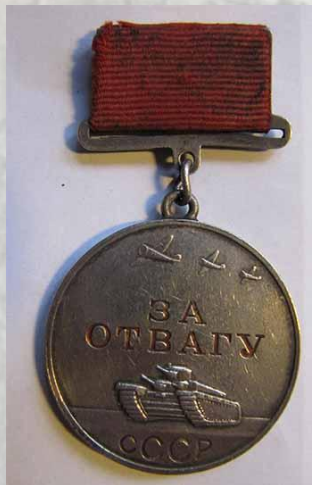
Медаль «За отвагу» (19.02.1943)