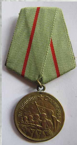
Медаль «За оборону Сталинграда» (1943)