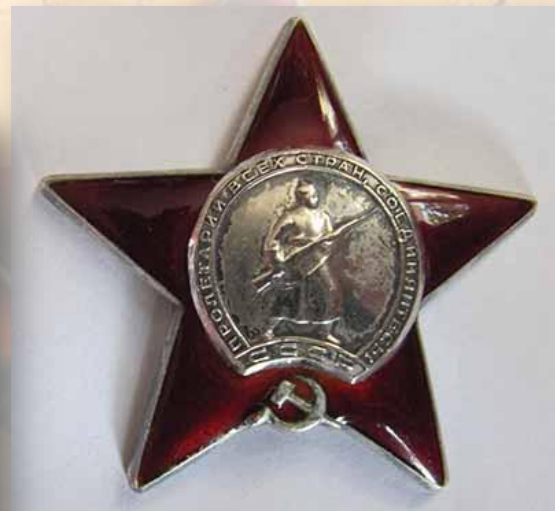
Орден Красной Звезды (9.05.1944)