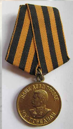
Медаль «За победу над Германией в Великой Отечественной войне 1941-1945 гг.» (1945)