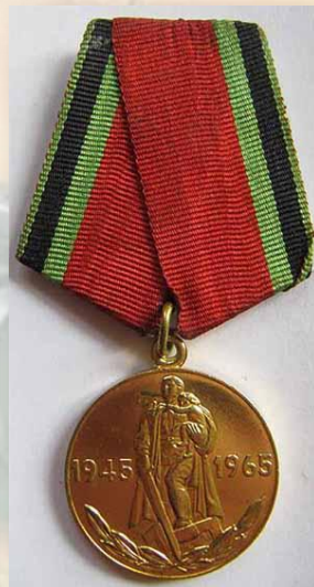
Медаль «Двадцать лет Победы в Великой Отечественной войне 1941-1945 гг.» (1965)